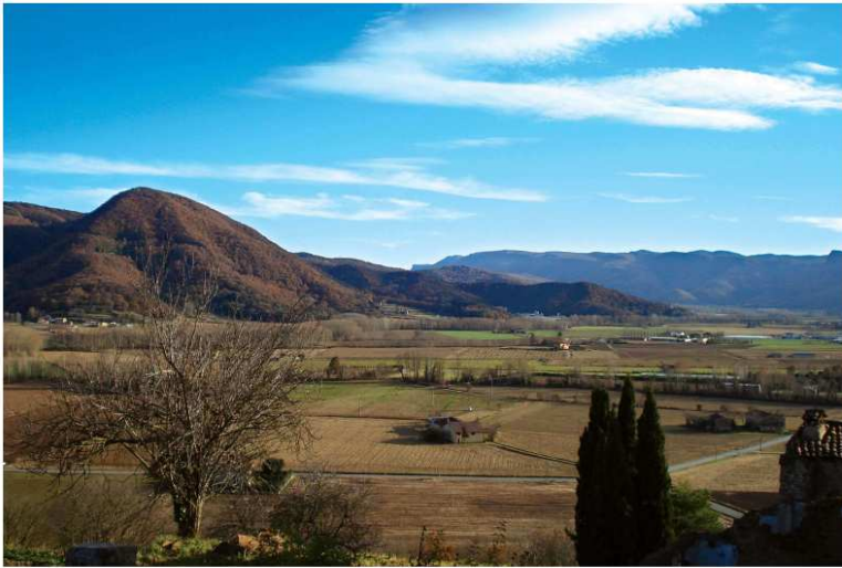
Vistes de la Vall d'en Bas (des del Mailot)