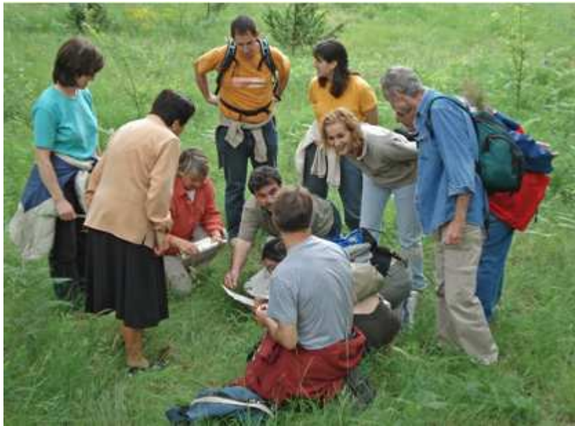
Excursió de reconeixement d'orquídies